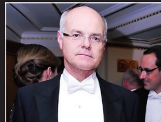
7. CASINOS AUSTRIA Karl Stoss & Co.