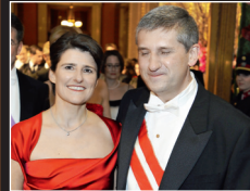
2. VIZEKANZLER Spindelegger, Fasslabend.