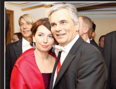
1. BUNDESKANZLER Faymann, Ostermayer.