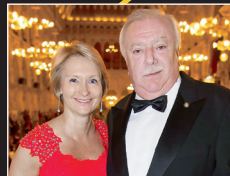
6. BÜRGERMEISTER Michael Häupl.