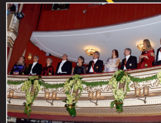
13. MITTELLOGE Regierung, dann ORF.