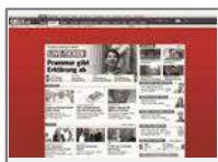
Wallpaper 3-teilig (Skyscraper, Superbanner XL, Skyscraper oder Sitebar) jew. max. 40kb

Großflächiges Ad kombiniert Skyscraper, Superbanner XL und Skyscraper oder Sitebar.