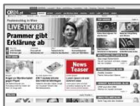
Startseiten-Teaser Top News (190x95 Bild, Titel: 46 Zeichen, Text: 79 Zeichen inkl. Leerzeichen)

Prominente Platzierung auf der Startseite in der Top News Box. Nur Fixplatzierung möglich.