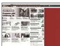
Sitebar IAB (dynamisch <400x800) max. 80kb

Passt sich dynamisch jeder Bildschirmgröße an und garantiert so eine größtmögliche Darstellung.