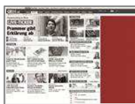
Sitebar IAB (dynamisch <400x800) max. 80kb

Passt sich dynamisch jeder Bildschirmgröße an und garantiert so eine größtmögliche Darstellung. Die Hintergrundfarbe der Seite kann an Ihr Werbemittel angepasst werden.