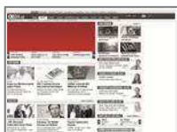
Startseiten-Teaser Konsole (610x202)

Die prominenteste Platzierung auf den Startseiten. Format ähnlich einem Half Page Ad Wide. Nur Fixplatzierung möglich.