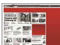
Sitebranding (Superbanner XL + Sitebar + Medium Rectangle) max. 2x40kb +1x80kb (Siteb.)

Lässt die Seite im Look & Feel eines bestimmten Produkts erscheinen.