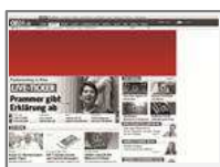
Billboard (960x250 od. 940x250) max. 80kb

Das Billboard erstreckt sich aufmerksamkeitsstark über die Breite der Website. Die Hintergrundfarbe der Seite kann an Ihr Werbemittel angepasst werden.