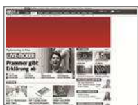
Billboard (960x250 od. 940x250) max. 80kb

24 Stunden** fix platziert auf allen wichtigen Startseiten (oe24.at, wetter.at, wetter.at-Bundesländer). 600.000 Sichtkontakte garantiert