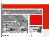
Sitebranding (Superbanner 990x100 + Sitebar + Medium Rectangle) max. 2x40kb +1x80kb (Siteb.)

Lässt die Seite im Look & Feel eines bestimmten Produkts erscheinen.