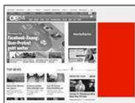
Sitebar IAB (dynamisch <400x800) max. 80kb

Passt sich dynamisch jeder Bildschirmgröße an und garantiert so eine größtmögliche Darstellung.