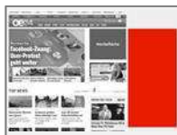
Sitebar IAB (dynamisch <400x800) max. 80kb

Passt sich dynamisch jeder Bildschirmgröße an und garantiert so eine größtmögliche Darstellung. Die Hintergrundfarbe der Seite kann an Ihr Werbemittel angepasst werden.