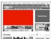
Startseiten-Teaser Konsole (620x310)

Die prominenteste Platzierung auf den Startseiten. Format ähnlich einem Half Page Ad Wide. Nur Fixplatzierung möglich.