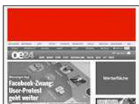
Billboard (960x250) max. 80kb

Das Billboard erstreckt sich aufmerksamkeitsstark über die Breite der Website. Die Hintergrundfarbe der Seite kann an Ihr Werbemittel angepasst werden.