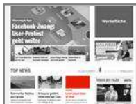
Startseiten-Teaser Top News (190x95 Bild, Titel: 42 Zeichen, Text: 70 Zeichen inkl. Leerzeichen)

Prominente Platzierung auf der Startseite in der Top News Box. Nur Fixplatzierung möglich.