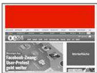
Billboard (960x250) max. 80kb

24 Stunden** fix platziert auf allen wichtigen Startseiten (oe24.at, wetter.at, wetter.at-Bundesländer). 600.000 Sichtkontakte garantiert