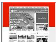
Wallpaper 3-teilig (Skyscraper, Superbanner 990x100, Skyscraper oder Sitebar) max. 3x40kb

Großflächiges Ad kombiniert Skyscraper, Superbanner XL und Skyscraper oder Sitebar.